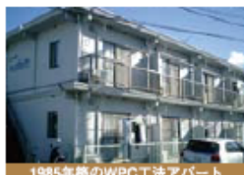
1985年築のWPC工法アパート 入居率93%、高い入居率を継続