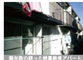
築年数の経った軽量鉄骨アパート 入居率約70%、空室目立つ